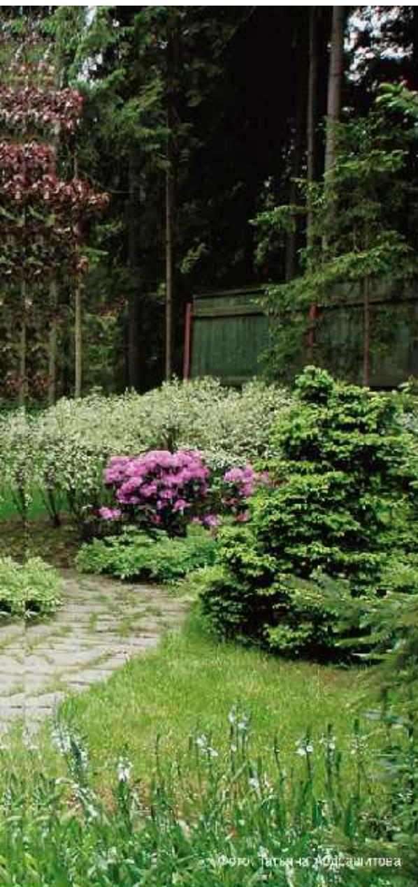
Фото: Татьяна Ходасылтова