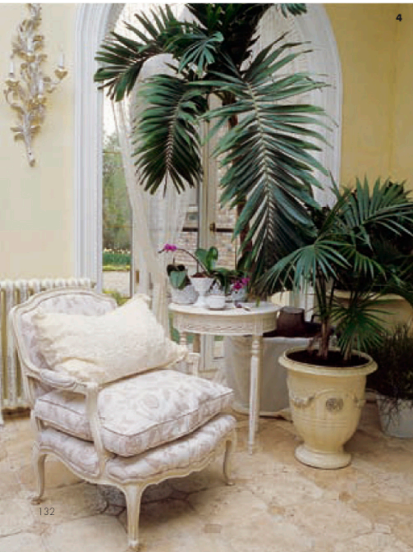
1 Вид из столовой на зимний сад. Стол окружен шестью разномастными стульями. «Они придают интерьеру живость». 2 Дом продолжает расти. В прошлом году к нему были пристроены зимний сад и тренажерный зал, соединенные между собой галереей. Антикварные серебряные фонари привезены из Англии. Пол выложен травертином. 3 Холл на втором этаже. Печная стенка облицована изразцами ручной работы, Eco Ceramica. Ковер из галереи Марка Патлиса. 4 Фрагмент зимнего сада. Бра, Chelini.