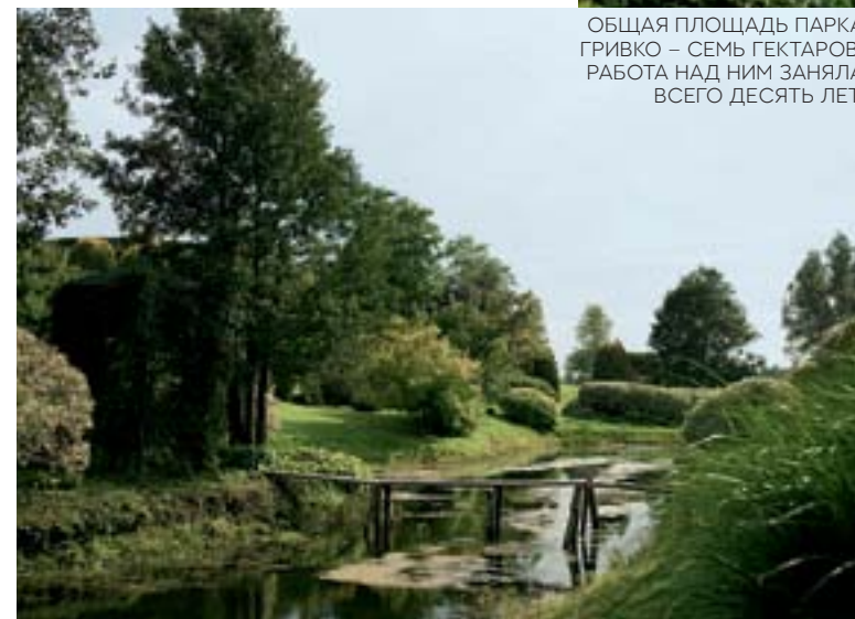
ОБЩАЯ ПЛОЩАДЬ ПАРКА ГРИВКО – СЕМЬ ГЕКТАРОВ. РАБОТА НАД НИМ ЗАНЯЛА ВСЕГО ДЕСЯТЬ ЛЕТ.

НА МЕСТЕ БЫВШЕГО БОЛОТА УСТРОИЛИ ПРУД – БЕРЕГА УСАДИЛИ ДЕРЕНОМ, ТУЯМИ И КРАСНОЛИСТНЫМИ КЛЕНАМИ.