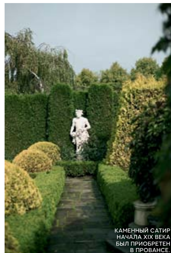
КАМЕННЫЙ САТИР НАЧАЛА XIX ВЕКА БЫЛ ПРИОБРЕТЕН В ПРОВАНСЕ.